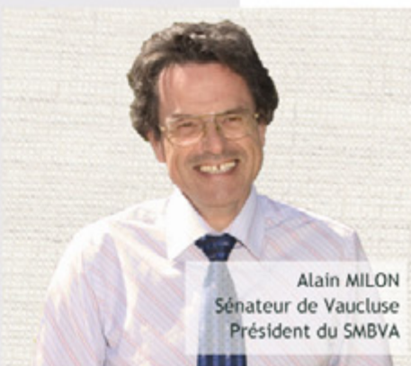
Alain MILON Sénateur de Vaucluse Président du SMBVA

Je vous donne d'ores et déjà rendez-vous à la rentrée, pour la publication des Actes Complètes des Forums, et la tenue le 20 octobre prochain du Grand Séminaire public de restitution du diagnostic.